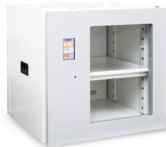
CUBE H/CUBE HC (제습보관함)